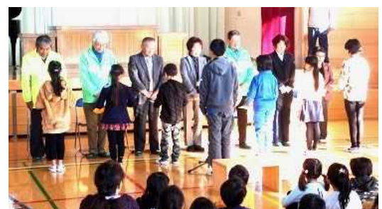
＜代表児童が感謝の手紙を渡しました＞