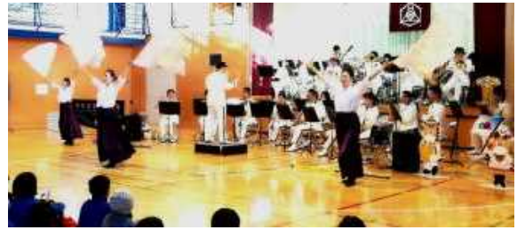
＜コンサートの様子＞

音楽隊の演奏は非常に迫力があり、また、子供たちにとって親しみのある曲ばかりだったので、児童全員、とても楽しそうに聴き入っており、素敵な時間を過ごしました。