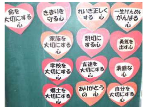
<道徳で学ぶ内容(抜粋)>

西小のみんなに美しい心をたくさんもった子になってほしい。だから、道徳の時間に一生懸命考えて、どんどん自分の考えを言うようにしてくださいね。