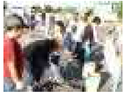
<道で拾ってきたゴミを分別>

また、こういった活動に親子で参加することを通して、子供たちに奉仕や協力などの大切な心を育むことができていると思います。本当にどうもありがとうございました。