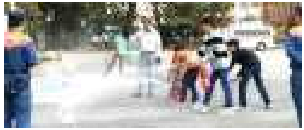
＜代表者による消火訓練＞

放課後には、地震発生時を想定した引き渡し訓練を行いました。実際に大地震が起きたときは車でのお迎えは難しいことから、保護者の皆様には徒歩でいらしていただき、大変お世話になりました。災害への対応については、様々な事態を想定して、ご家族で話し合う機会をもっていただけるとありがたいです。