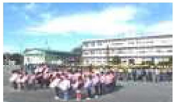
＜航空写真撮影中の様子＞

11月26日（月）に航空写真撮影を行いました。本校では20年ぶりの航空写真撮影になります。全校児童で西小の校章の形を作り、「さよなら平成記念」ということで、「30」の文字も作りました。その後、各学級ごとの集合写真も撮影しました。子供たちにとって一生に一度になるかもしれない良い経験だったと思います。