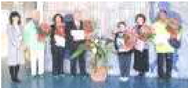
＜ありがとう集会にみえた地域の方々＞

11月27日の朝、大きな地震がありました。一瞬ですがかなり強く揺れたので、全校放送を入れましたが、その前に、各教室で子供たちは黙って素早く机の下に潜るといった避難行動をとることができていました。1年生の教室に来ていた読み聞かせボランティアの方々が、「日頃の指導や訓練の成果だと感じた」と感心されていました。