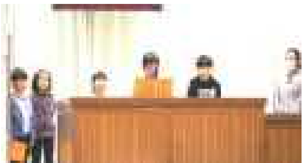
<感想文発表の様子>

子供たちが発表した感想文の言葉です。 「意地悪しないで優しくしてあげれば、優しさは戻ってくる。」 「正直な心を育てて正直な大人になりたいです。」 「私は正直な自分になるために『ありがとう』や、言われてうれしい言葉を使います。」 「困っている人がいたら優しく助けてあげたい。」