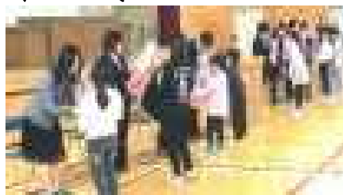
<退任者へお花のプレゼント>

4月12日(金)5校時に退任式が行われ、子供たちは本校を去られた先生方から最後のお別れの言葉を聞きました。みんな真剣な顔で話を聞き、涙を流す子供もたくさんいました。また、6校時は各学年にわかれて、学年に係りのある先生方とのお別れの会をあらためて行いました。とても心温まる素敵な会となりました。